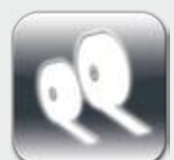
Minigurt / Maxigurt